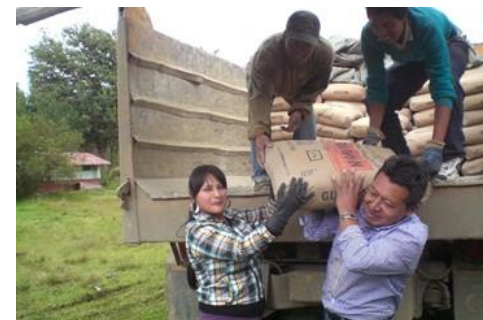
Entrega de Materiales a Comunidades

Cerramiento de Cancha de Uso Múltiple de Chilla Cerramiento de Cancha de Uso Múltiple de Chico Lalcote Comunidad de Monjas Recapeo de Cancha San José