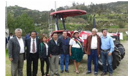
Entrega del Tractor Agrícola

✓ El Gobierno Provincial del Azuay hace la entrega del TRACTOR AGRICOLA (arado de tres discos, rotavador) en fecha 9 de Agosto del 2015 a fin de mejorar la productividad agrícola de los suelos de la parroquia y que fue utilizado por la Comunidad de manera subsidiada en el mes de Octubre y Noviembre del 2015.