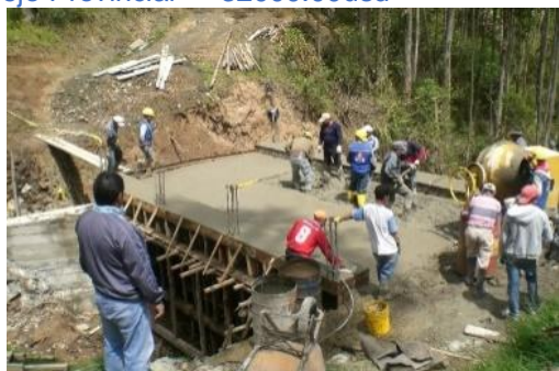
Puente Río Tasqui

Inversión Parroquial 1419.00usd. Inversión Concejo Provincial 32000.00usd