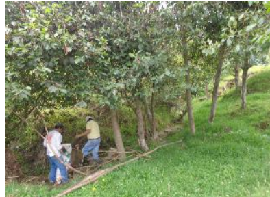
Mingas limpieza de quebradas