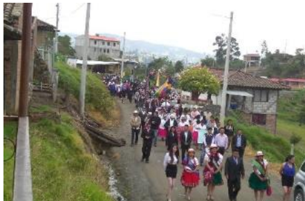
Aniversario Parroquial 2015.