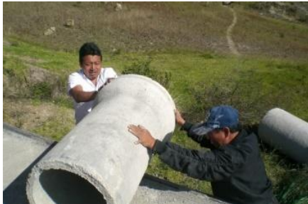
Mingas colocación tubería

✓ MINGAS COMUNITARIAS (colocación de tubería, limpieza de cunetas) en Proyecto de MANTENIMIENTO VIAL DE LA PARROQUIA realizado en los meses mayo-julio del 2015 y (mano de obra) en Proyecto de Materiales para la CONSTRUCCION DEL PUENTE RIO TASQUI que se encuentra concluido y en funcionamiento y Materiales para la CONSTRUCCION DEL PUENTE SIGUANCAY que se encuentra en ejecución. Mingas de Limpieza de las quebradas, entre otros.