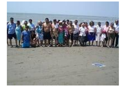
Paseo Adultos Mayores