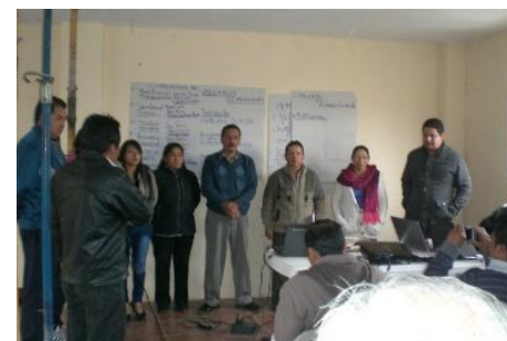
Consejo de Participación Ciudadana