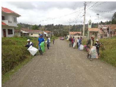
Mingas de limpieza

PARTICIPACION CIUDADANIA EN MINGAS Y ASAMBLEAS Refrigerios 305.81.00usd