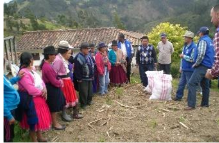
Entrega de semillas de maíz