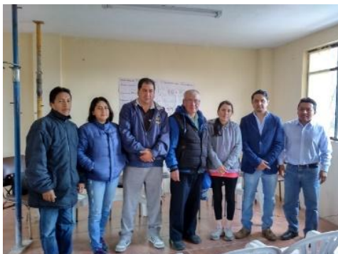
Consejo de Planificación

• INVERSION PRESUPUESTO PARTICIPATIVO 2015 LA CALIDAD DE LOS SERVICIOS PÚBLICOS Y PROPICIAR LA ORGANIZACIÓN DE LA CIUDADANÍA EN LA PARROQUIA: Planificar, y Fiscalizar proyectos en general.